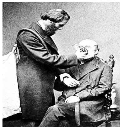
Figura: Joseph Thomas Clover demonstrando o seu aparelho clorofórmio, 1862. Disponível em: < https://upload.wikimedia.org/wikipedia/commons/1/19/Clover_with_his_chloroform_apparatus_1862.jpg >.

A foto é uma demonstração de um procedimento anestésico, feito por Joseph Thomas Clover, médico e importante nome no desenvolvimento desse tipo de